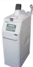
Soluscope Serie ENT