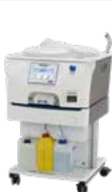
Soluscope Serie 3 PA

Zur ausschließlichen Verwendung mit dem Reinigungs- und Desinfektionsgerät Soluscope Serie 3 PA, Sprint, Sprint PT, Serie ENT & Serie TEE in Kombination mit Soluscope A Additive