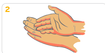
2 Die Creme Handrücken auf Handrücken über die gesamte Fläche verteilen.