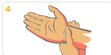
4 Nägel und Nagelfalze mit der Creme versorgen. Die Reste der Creme werden dann an den Handgelenken einmassiert.

EUROPEAN HEADQUARTERS: ECOLAB EUROPE GMBH Richtstrasse 7 8304 Wallisellen Switzerland +41 (0) 44-877-2001 www.ecolab.eu