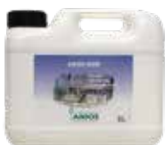
Anios RHW Bidon de 5 L Référence: 3103210

Une solution neutre de rinçage des instruments chirurgicaux et médicaux