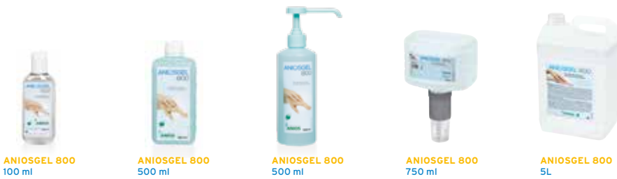
ANIOSGEL 800 100 ml

Gel hydroalcoolique pour la désinfection chirurgicale et hygiénique des mains.